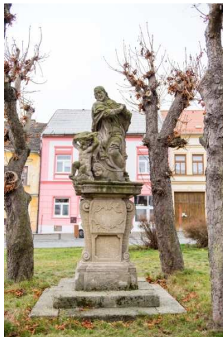
sv. Jan Nepomucký