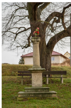
socha Panny Marie Immaculaty