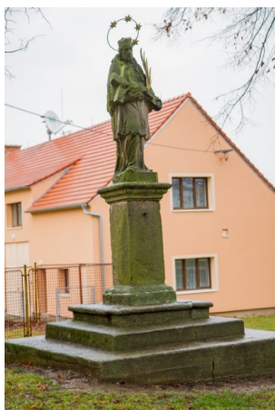
socha sv. Jana Nepomuckého

📍 Ve Vsi Touškov najdeme jednu sochu a podstavec se sloupem, na němž stávala druhá socha. Přiřaď k fotografiím správné názvy těchto soch.