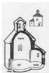
románský sloh (1)