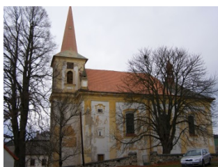
kostel sv. Jana Křtitele v Čížkově