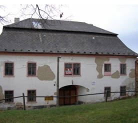
fara v Čížkově

? Přiřaď názvy budov či míst k fotografiím, které je zachycují. Doplň, v které obci se nacházejí.