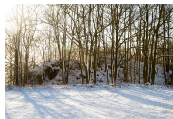
zřícenina hradu Strašná skála v Přešíně