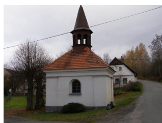
kaple Panny Marie v Zahrádce