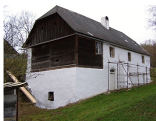
mlýn v Zahrádce