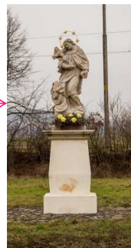
socha sv. Jana Nepomuckého