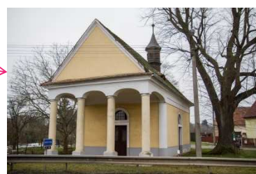
kaple Narození Panny Marie