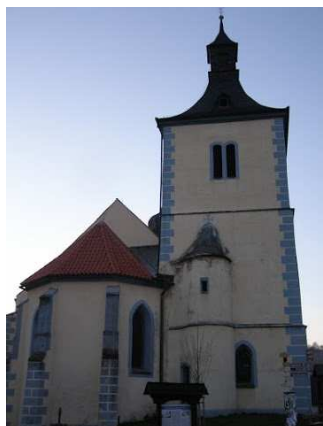
KOSTEL NANEBEVZETÍ PANNY MARIE